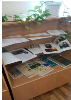
Музей ДМШ №7 им.З.В.Хабибуллина