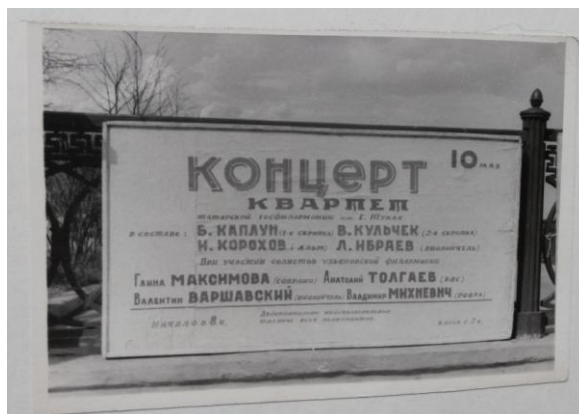
Афиша концерта струнного квартета